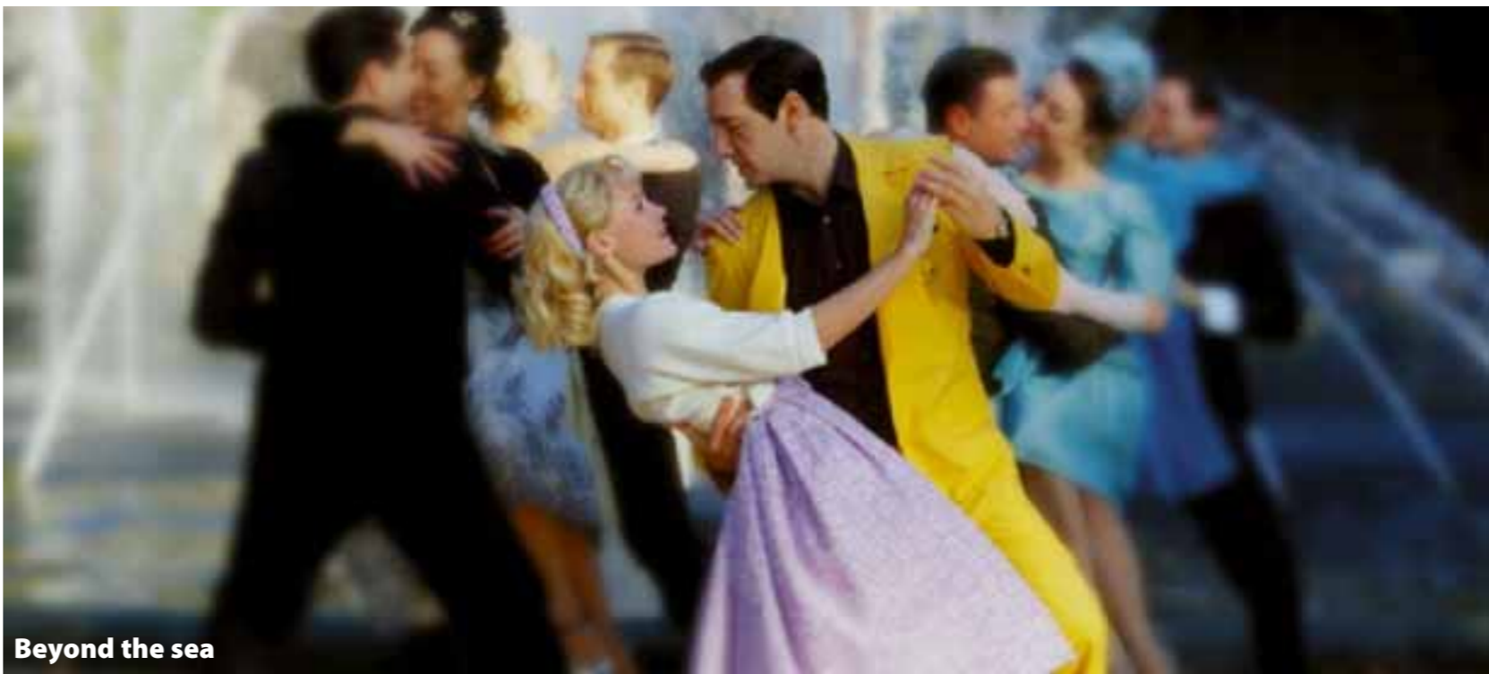
Beyond the sea